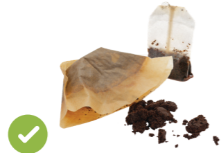
咖啡渣，過濾器 和茶包