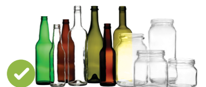
玻璃瓶和罐子 (包括碎玻璃)