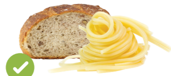
麵包，意大利面， 米飯和穀物碎片