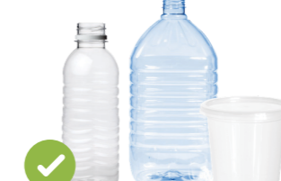
塑料瓶和容器 (沒有蓋子)