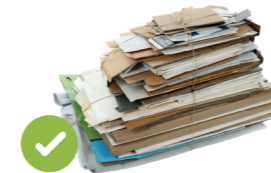
論文和雜誌 (不包括碎紙)