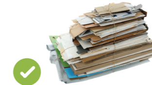
論文和雜誌 (不包括碎紙)