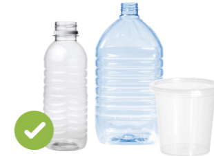
塑料瓶和容器 (沒有蓋子)