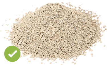
小貓垃圾和寵物垃圾