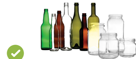
玻璃瓶和罐子 (包括碎玻璃)