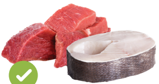
肉類，魚類和乳製 品